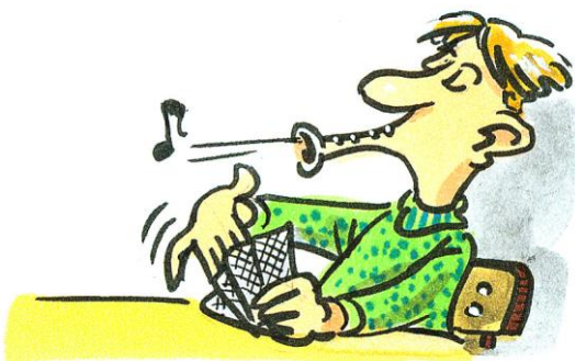
Abbildung 1: Skatflöte

Als Ende 2007 das neu gewählte Präsidium die Fäden der mittelfränkischen Skatwelt in die Hand nahm, hatten wir uns von Anfang an zum Ziel gesetzt, die Jugendarbeit wieder voran zu bringen und die Versäumnisse vergangener Tage aufzuarbeiten. Dies funktionierte nach einigen Startschwierigkeiten auch immer besser. Es wurde eine Jugendgruppe