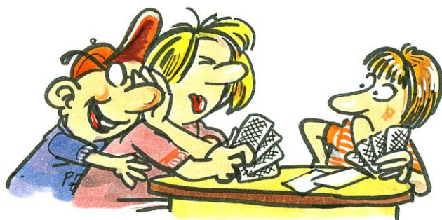
Abbildung 3: Dame drücken

In Mittelfranken haben wir das dahingehend gelöst, dass wir am Anmeldetag des Ferienprogramms [7] vor Beginn der Einschreibung die wartenden Eltern und Kinder ansprechen und sie auf den Kurs aufmerksam machen. Das Vorgehen wird mit einem Flyer [8] und einer kindgerechten Internetseite abgerundet.